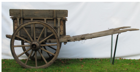
Vlaamse aardkar. ( V1987-0013)