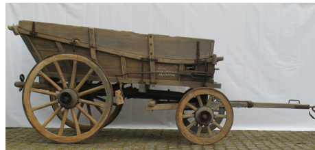
Polderwagen met afneembare zijborden. (524 )

zelf en kan een jaar later trots vaststellen dat het Karrenmuseum beschikt over de grootste en meest waardevolle collectie karren en wagens in Vlaanderen. "Wij hebben inderdaad de grootste en meest representatieve collectie voor heel Vlaanderen. Door mijn bezoeken aan andere musea hebben we nu bovendien in kaart kunnen brengen welke types voertuigen nog in onze verzameling ontbreken en waar we die eventueel op termijn nog zouden kunnen bekomen. Het is sowieso bijzonder goed geweest om de contacten met onze collega's opnieuw aan te halen."