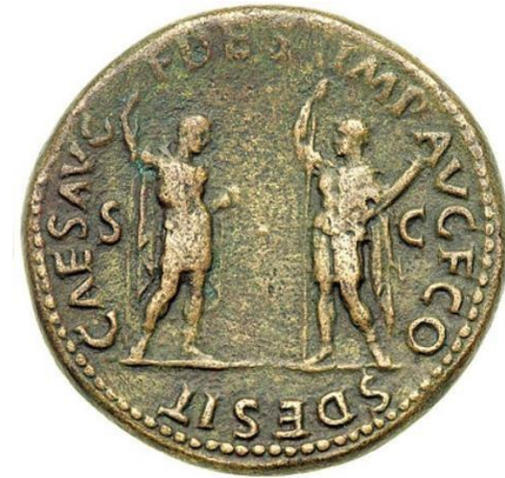
Een sestertie als propagandamiddel: deze munt is geslagen door keizer Vespasianus met een afbeelding van zijn twee zonen Titus en Domitianus, en waarmee hij zijn dynastieke ambities aangaf.