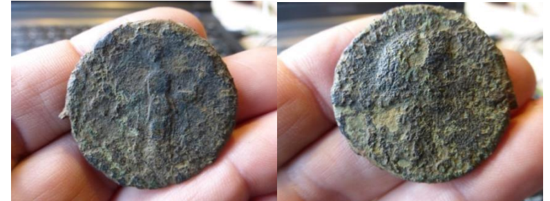
De munt- en kopzijde van de in Essen gevonden sestertius

Begin 2016 vond een metaaldetectorist een Romeinse Sestertie, die na determinatie herkend kon worden als een Faustina I: