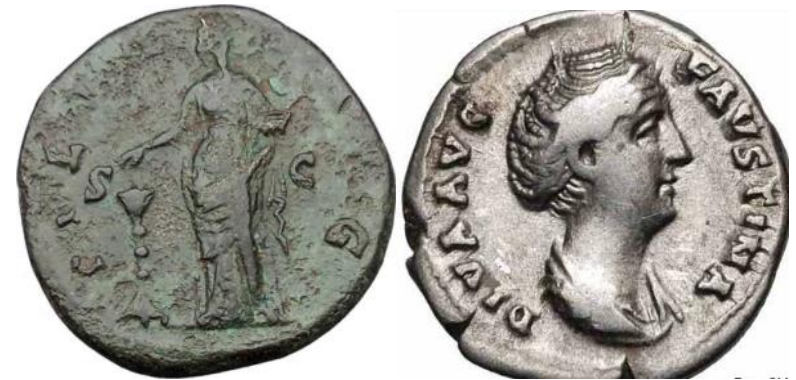
Dezelfde munt- en kopzijde van intacte(re) versies van hetzelfde type sestertie

De kopzijde van de munt toont ons een afbeelding van een vrouwen-gelaat: Anna Galeria Faustina. Zij was de echtgenote van de Romeinse keizer Antoninus Pius en leefde in de eerste helft van de tweede eeuw na Christus. Als gemalin van de keizer kreeg zij op het einde van haar leven ook het recht de titel van keizerin te dragen (van 138 n C tot haar dood in het jaar 141) : vandaar de AVGVSTVS AVGVSTA, keizerin op de munt.