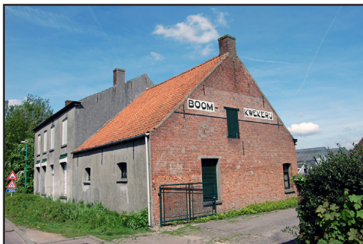
Boomkwekerij Nelen.

Aan Stationsstraat 136 het Volkshuis: de thuishaven van de 100-jarige Essense socialistische zuil en van harmonie “De Werker”.