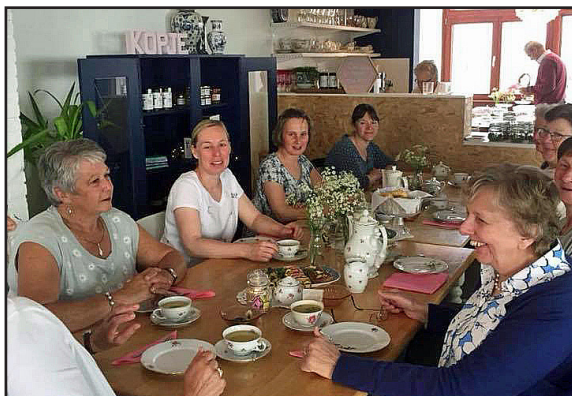
High Tea van KVLV Wildert in Kopje in 2018.