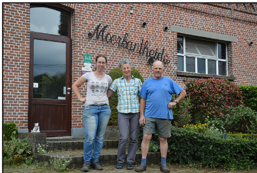
B&B Moerkantsebaan.

Terug de Sint-Jansstraat op. Dan de Beylestraat, het Rose Grononpad en de Zandstraat tot aan de Oude Baan.