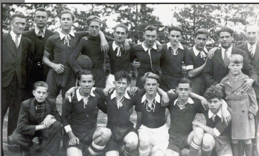
Excelsior Essen - Berchem 1-6.