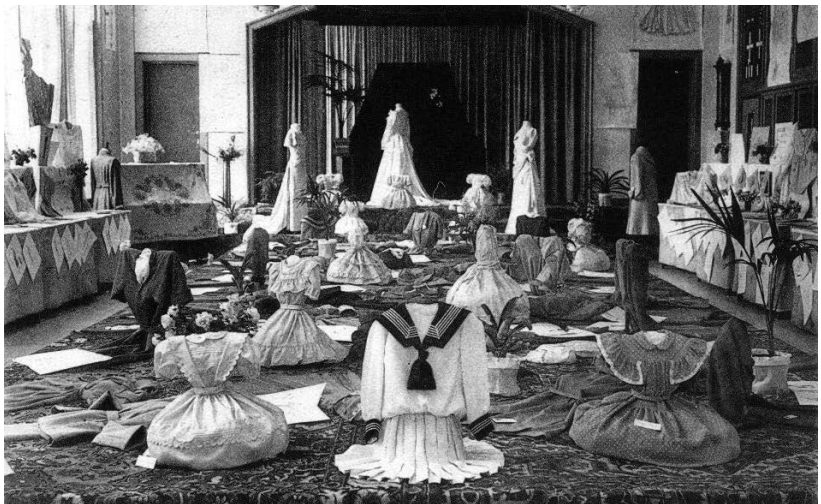
Fig.2: Tentoonstelling Mariaberg 1951.