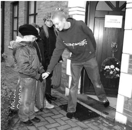
Fig.2: De nieuwjaarszangers krijgen iets in de Hondberg, 2009.

Gelukkig gebeurde dat in die jaren blijkbaar niet dikwijls: “Ik zal ’t maar zeggen gelijk as dat het is, da mosten we nie veul zingen”.