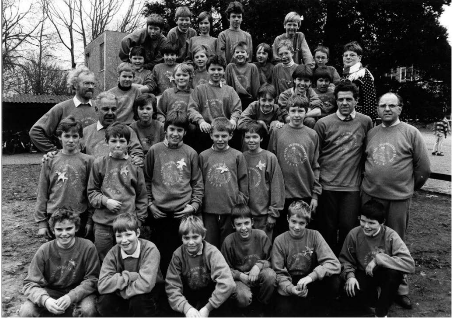
Fig.2: De sneeuwklassers van 1986.

Elbigenalp moet stellig vermeld worden. De Essense jeugd heeft ervan genoten en heel wat geleerd.