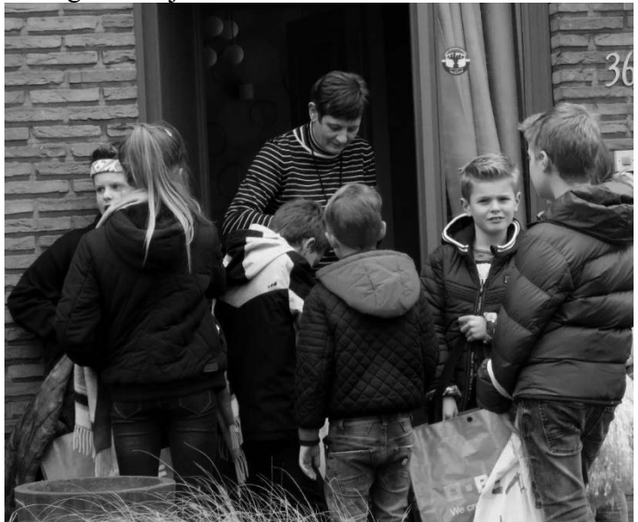
Fig.3: Ook in de Cardijnstraat is men gul voor de nieuwjaarszangertjes, 2018.

“Klein zieltjes, klein zieltjes. Staan achter de deur. Klein zieltjes, klein zieltjes. Waar treurde gij veur? Gij mot zoo niet treuren veur d’engels gebod. En valt op uw knieën en bidt voor God. Met wat fatsoen, met wat fatsoen. Ze zullen den hemel wel opendoen. Ze aaien den hemel al opengedaan. Daar kwamen twee engeltjes voor hen staan. Twee engeltjes mee nen gouwen band. Zoo trekken wij naar een ander land. En haja, ’t is waar, en haja ’t is waar. ‘k Wensch jou een zalig nieuwjaar.”