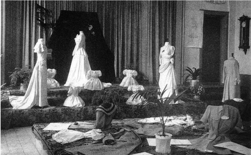
Fig.1: Tentoonstelling Mariaberg 1951.

ondergrond, schoon genoeg om een koningsbed te sieren; en ten slotte die talrijke confecties; meer dan 200 bloesen, mantels, kleeuren, complets, die niet moeten onderdoen voor de rijkste pitstalling van den 'Bon Marché' en de 'Innovation' en dit alles naar de laatste snit en de laatste mode, doch vooral deftig en zedig.