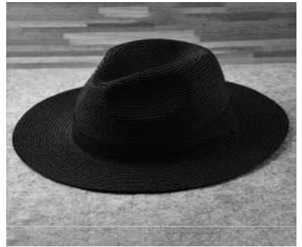
gleufhoed of borsalino