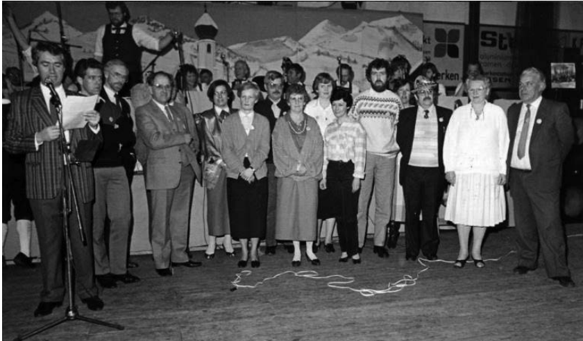
Fig.3: In 1986 organiseerde het Sint-Jozefinstituut naar aanleiding van 15 jaar sneeuwklassen een grote Oostenrijkse avond in het Heuvelhal.