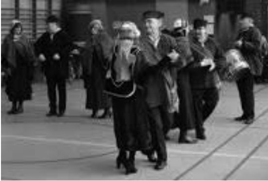
St Sebastiaansgilde in actie

Er kwamen auto's, een betere centrale verwarming en later de airconditioning, de lossere omgang met mode en sociale regels..... hierdoor werd het dragen van een hoed meer een keuze dan een verplichting.