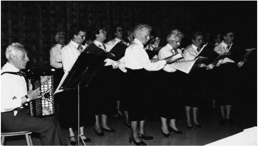
Fig.2: Het Sint-Ceciliakoor van Essen-Statie in het Parochiecentrum.