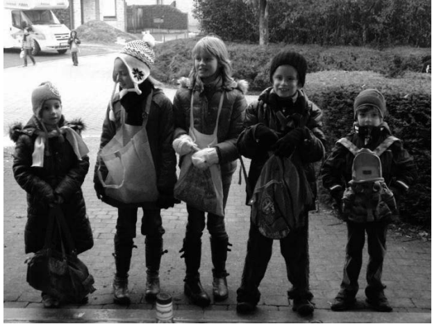
Fig.1: Nieuwjaarszangertjes Den Uil, 2009.

Der is een holleken in de deur. Der hangt een zak met zemels veur. Ieder zemel is een luis. Der zit een gierige pin in huis.”